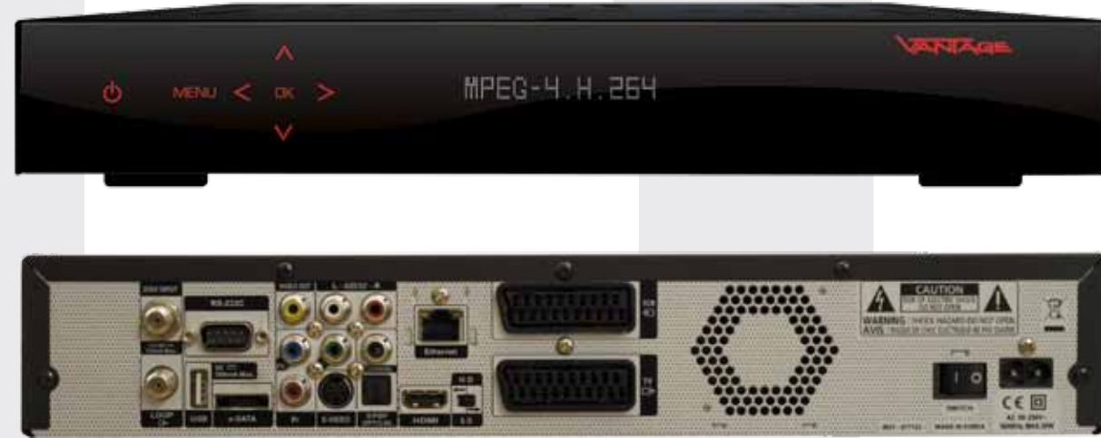
Abb. HD 7100